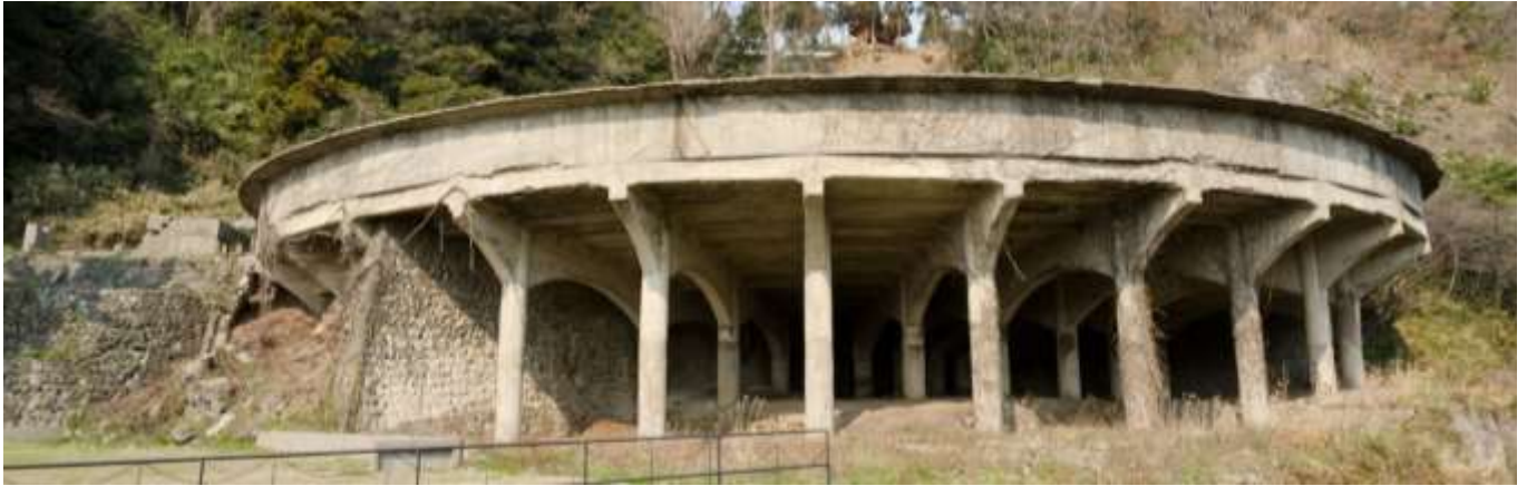
(国史跡 50mシックナー)

日時 平成30年10月6日(土) 10:15~12:00 (集合時間 10:00)