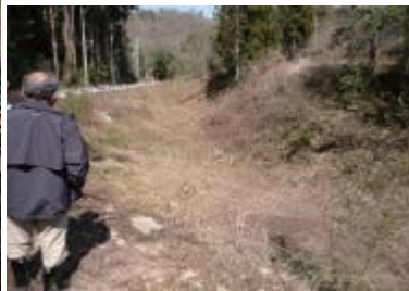
立残山の大流し水路