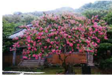
《島内特別賞》加藤洋子 3 「百日紅の思い出」 撮影地：北田野浦西方