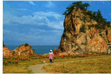
《新潟フジカラー賞》三田憲一 4 「朝の散歩」 撮影地：藻浦崎