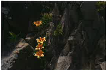
《JA佐渡賞》中村芳子 8 「遅しく咲く」 撮影地：片野尾 赤亀風島