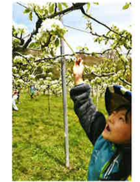
《JA羽茂賞》高野美歌 12 「お…おいしい実になっ…てね～」 撮影地：羽茂