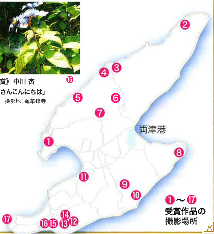
1 ~ 17 受賞作品の 撮影場所