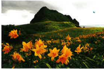
《島外特別賞》田村 勲 2 「お花畑」 撮影地：大野亀