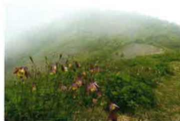
《特選》中道康夫 6 「縦走路のヤマオダマキ」 撮影地：大佐渡縦走路