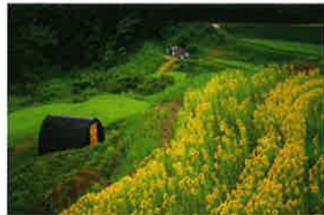
《佐渡汽船賞》松林 宏 10 「棚田を彩る」 撮影地：岩首