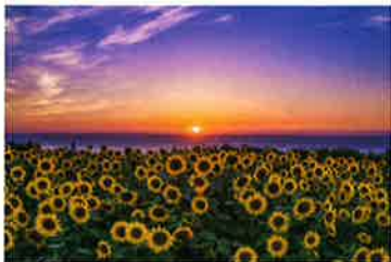
《JA佐渡賞》佐野敏明 5 「真夏の落陽」 撮影地：相川地区