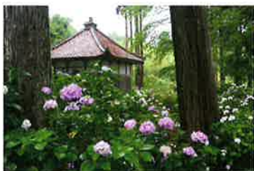
《佐渡観光交流機構賞》池本智子 16 「蓮華峰寺の紫陽花」 撮影地：蓮華峰寺