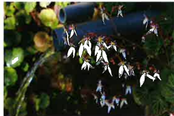
《佐渡汽船賞》加藤幸雄 9 「山の恵」 撮影地：畑野地区小倉