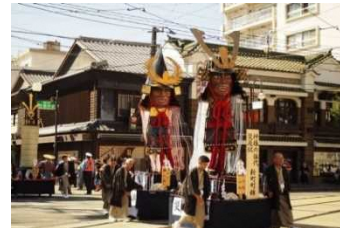
【熊本市】藤崎八幡宮例大祭の神幸行列