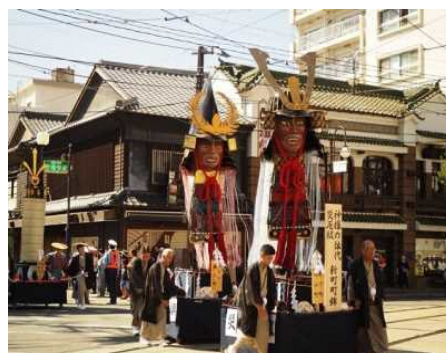
【藤崎八幡宮例大祭の神幸行列】

国指定の重要文化財「熊本城」を核として、周辺に広がる城下町一帯を行列が練り歩く藤崎八幡宮例大祭、また、史跡「熊本藩川尻米蔵跡」を有し、かつて港町として栄えた町並みを背景に行われる河尻神宮秋季大祭などにより形成される、歴史的な風情を有する良好な市街地の環境の維持向上を図るため、熊本地震により被災した「熊本城」をはじめとする歴史的建造物の保存修理・修景や、市内の歴史的建造物を回遊するための道路の美装化、歴史・文化を活かした観光体験事業等を位置づけています。