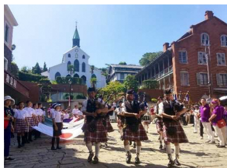
【長崎居留地まつり】

国宝「大浦天主堂」や国指定の重要文化財「旧グラバー住宅」、及びその周辺地域と、歴史的建造物等の保存活動の一環として始まった長崎居留地まつりや大浦諏訪神社の大浦くんち等の伝統的な活動が一体となった、歴史的な風情を有する良好な市街地の環境の維持及び向上を図るため、旧グラバー住宅をはじめとする歴史的建造物の保存修理や、夜間景観の整備、景観を損なう空き家の除却等の事業を位置づけています。