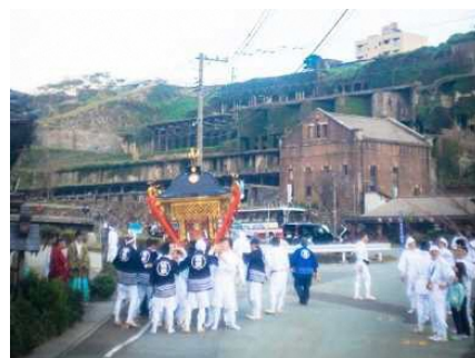
【佐渡市】善知鳥神社祭礼

国指定の重要文化財「旧佐渡鉱山採鉱施設」、国指定の史跡「佐渡金銀山遺跡」及びその周辺の鉱山町一帯と、善知鳥神社祭礼や鉱山祭とそこで披露される郷土芸能、無名異焼の製造・販売等が一体となった、歴史的な風情を有する良好な市街地の環境の維持向上を図るため、歴史的建造物の保存修理、公有化した旧深見家住宅等の歴史的建造物を活用した拠点施設整備、それら歴史的建造物を回遊するための道路の美装化等の事業や、相川音頭を踊るイベントの宵乃舞など、地域行事の運営に対する支援を位置づけています。