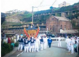
【佐渡市】善知鳥神社祭礼