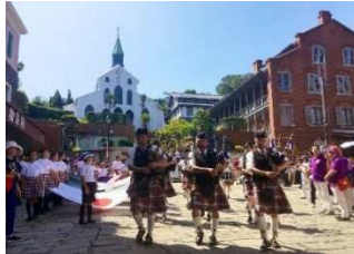
【長崎市】長崎居留地まつり