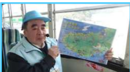
(車内でジオポイントを解説)

復路 江積 12:31 発～沢崎～太鼓体験交流館～宿根木～小木港 13:10 着