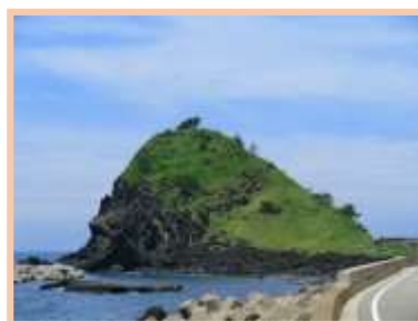
(車窓から見えるジオポイント「神子岩」)