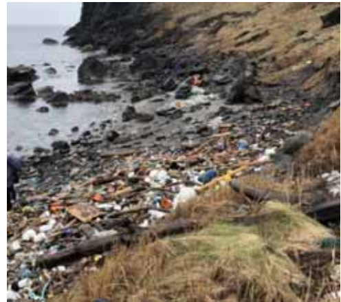
写真：大野亀海岸北端（こみが一番堆積しているポイント）