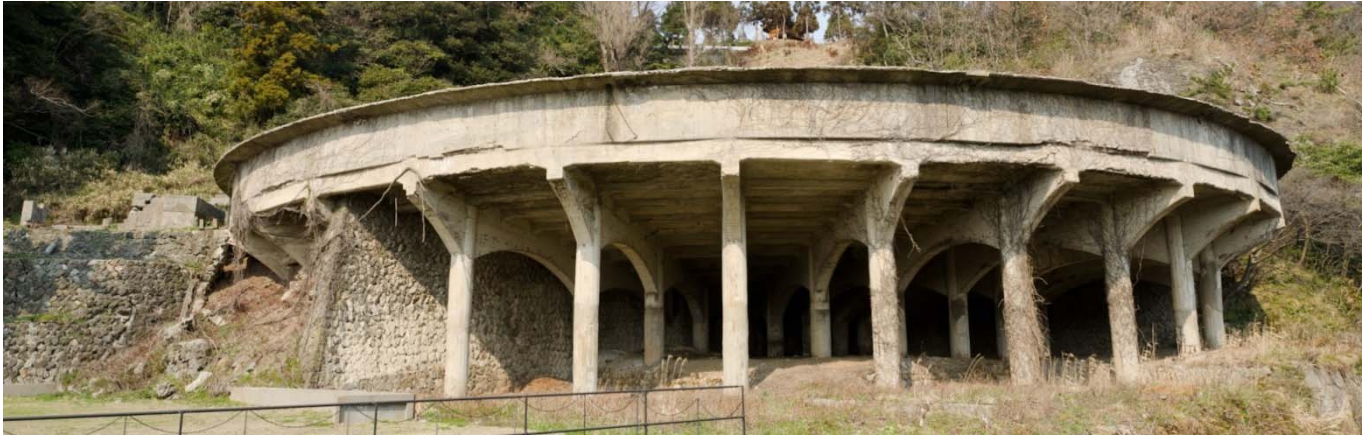
(国史跡 50mシックナー)

日時 平成30年10月6日(土) 10:15~12:00 (集合時間 10:00)