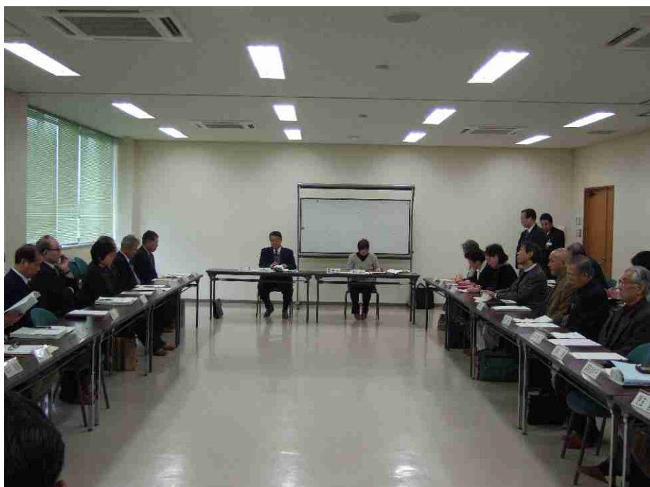
第8回 生涯学習推進会議（平成19年1月）

そのためには、組織の整備充実が必要であり、全庁的な視野による改善策等を協議するための生涯学習推進本部、生涯学習推進計画の進捗状況を把握し、評価・改善等を図るための生涯学習推進会議の設置など、行政内の連絡・調整組織の整備充実と活性化を目指します。