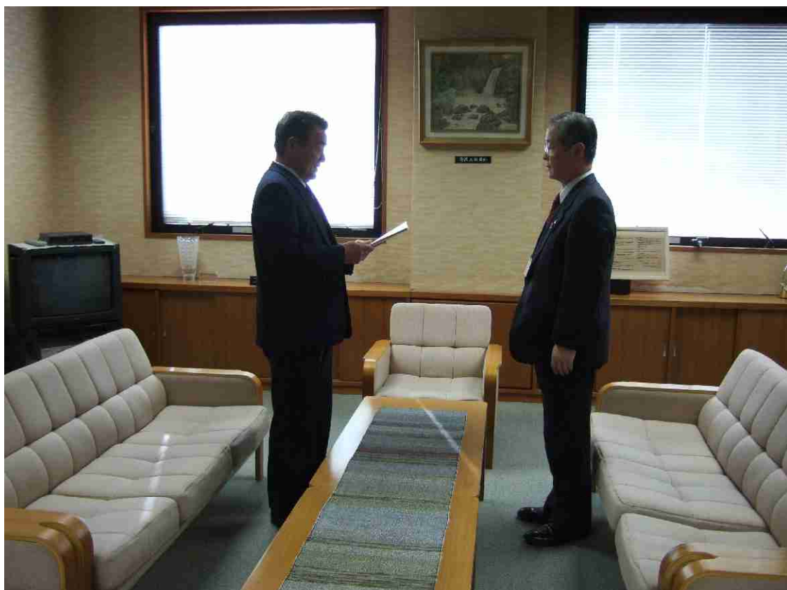
佐渡市生涯学習推進計画の策定についての答申書提出（平成19年2月5日）