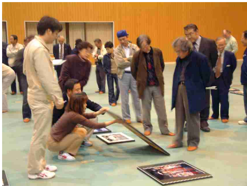
佐渡市展作品審査

伝統文化を後世に伝えるために活動を支援するとともに、新しい文化活動を奨励します。また、学習施設を整備するとともに文化活動を活発にするために、情報の収集と提供に努め、指導者の確保と養成を図ります。