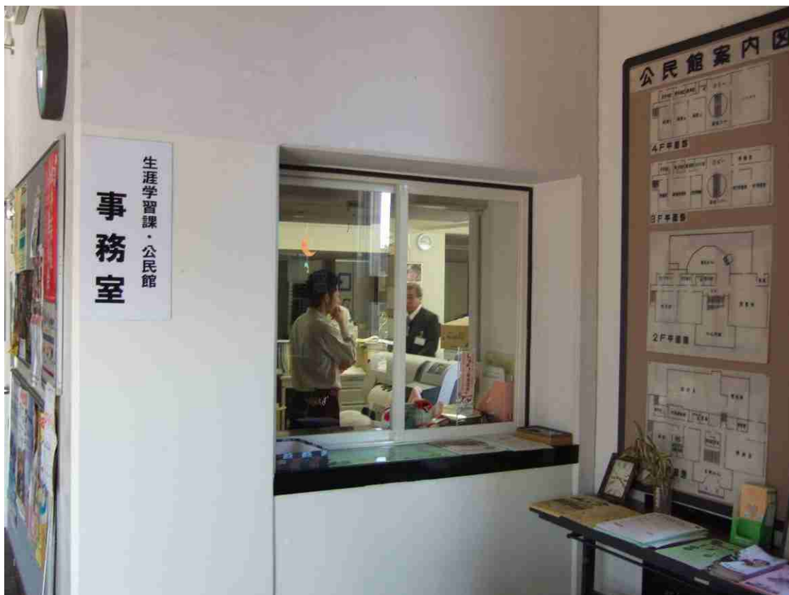
生涯学習課 相談窓口

相談員を配置し、相談窓口を設置するため、市民ボランティアを活用するなど学習相談体制の整備・充実を推進します。