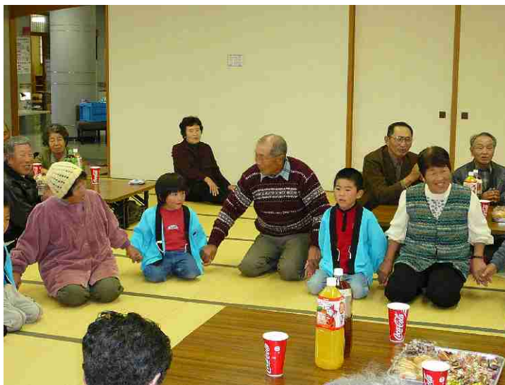
高齢者学級 世代交流会

生涯健康で明るく生きるために、健康管理の重要性について学習できる施策を展開します。そして、心身の健康に関心を持ち、健康について学ぶ場が提供され、生涯健康で生活を営むことができる社会の実現を推進します。