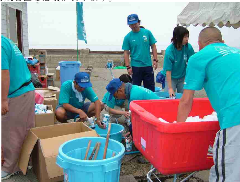
トライアスロンボランティア活動

今後、多種多様化、高度化する学習要求に応え、ボランティア活動を推進するために指導者の育成を図る必要があります。