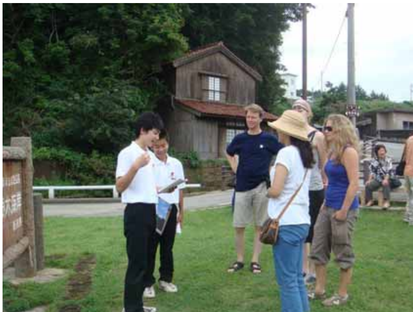
中学生による観光ボランティアガイド (小木中学校宿根木ボランティア部)

海上交通コストと島内交通コストの低減と利便性を図り、価格競争力のある企画商品の開発を進めます。