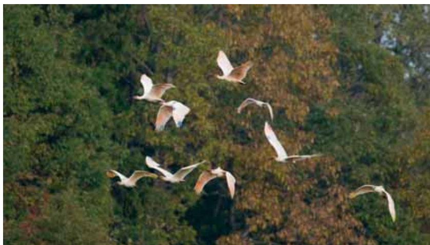
群れをなして飛ぶトキ

する人材を育てるため、小・中学校に環境副読本を配付し、環境教育・環境学習の促進を図っています。