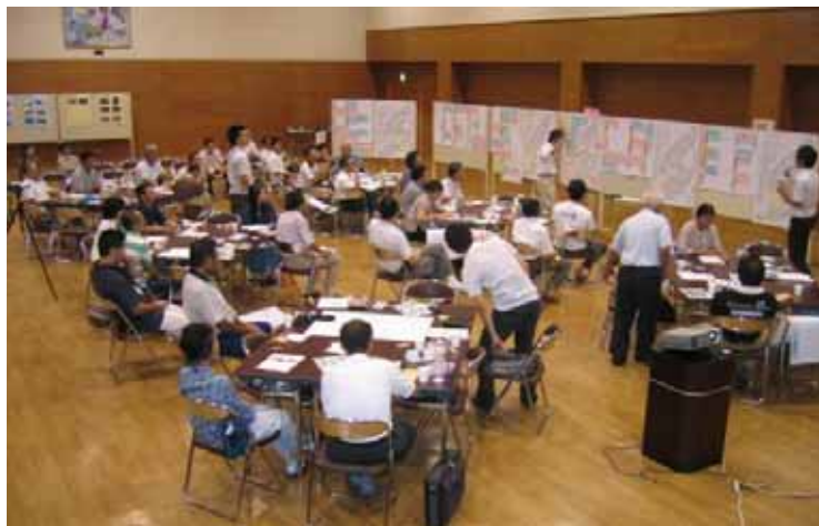
市民が計画策定に参加するワークショップ

パブリックコメント...公の機関が計画や条例などを制定しようとするときに、広く公に意見・情報・改善案などを求める手続きのこと。