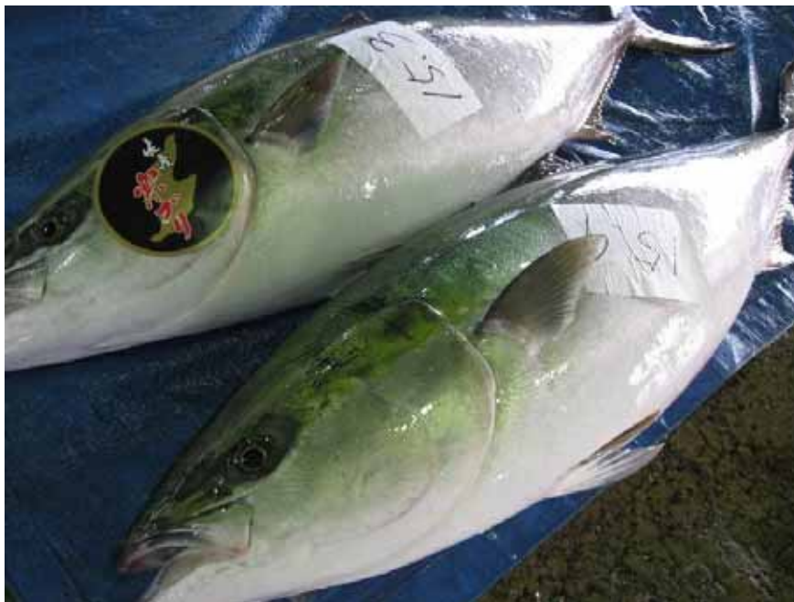
ブランド化を目指す寒ブリ

水産業・漁村が有している多面的機能が発揮されるよう、水域環境の保全、漁港海岸の保全と環境整備による安全な地域づくり推進の一環として、海山の連携活動を始め、体験学習・交流事業を促進します。さらに、海洋深層水の利活用の促進に取り組みます。