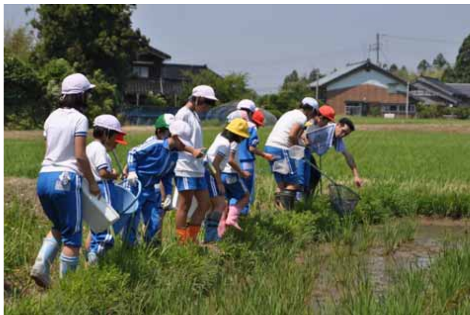
佐渡学による生き物調査

また、職員研修体制の確立と指導者の育成とともに、教育相談体制の整備・充実に努めます。