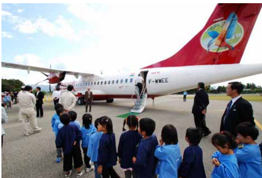
フランスATR社製ターボプロップ機によるデモフライト

また、本市の地域経済活性化のためには、大都市圏との航空ネットワークの形成が重要ですが、現空港の滑走路長 890mでは、ジェット機等による大都市圏との直行便の就航は困難であり、空港の拡張が必要となっています。大都市圏へ就航可能な滑走路延長 2,000m級の空港拡張整備計画については、早期に事業化できるよう、県とともに取り組んでいるところです。