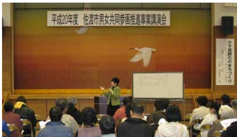
男女共同参画推進事業講演会