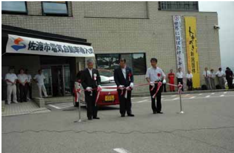
県内自治体初の電気自動車の導入

離島である本市の光熱費は、本土の物価より高く、島内の発電電力量は火力に9割以上と大きく偏っているため、佐渡産のエネルギーが必要となっています。このことから、平成18年2月に「地域新エネルギービジョン」を策定し、新エネルギーの導入に取り組んできました。また、平成21年3月には経済産業省の「EV・pHV(電気自動車・プラグインハイブリッド自動車)タウン構想」の実施地域として新潟県が選定され、そのモデル地区となった本市は、普及・啓発を図るため、県内自治体として初めて公用車に電気自動車を率先導入しました。