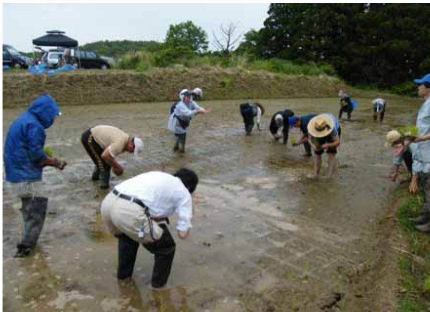
島外在住者による農業体験

団塊世代を始めとしたU・Iターン者の受入れを促進するため、空き家を含めた佐渡の情報発信や島暮らし体験により定住を図り、高齢者の知識、経験等コミュニケーションによる地域の活性化を図ります。