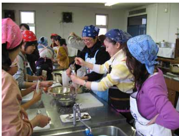
外国人を対象とした料理教室

多文化共生社会...国籍や民族などの異なる人々が互いの文化的違いを認め合い、対等な関係を築こうとしながら、地域社会の構成員として共に生きていくこと。