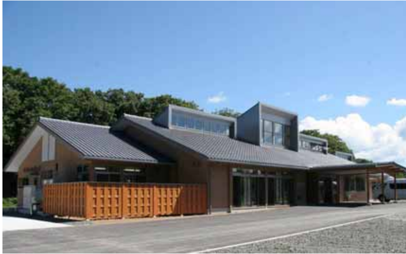
真野第2保育園と西三川デイサービスセンターの複合施設

このように高齢化が進む中、医療・福祉分野における人材不足解消と民間活力の助長・活用を推進し、だれもが安心して暮らせる環境・地域づくりが必要となっています。