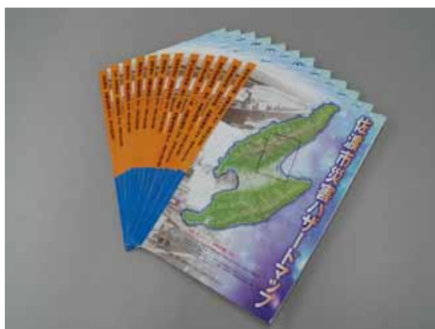
防災ハザードマップ

河川敷の草刈等適切な管理については、引き続き、河川愛護意識の高揚を図り、地域住民の協力を得ながら潤いのある水辺空間の創出を促進します。