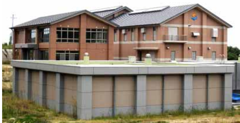
平成 24 年 4 月供用開始予定の相川浄水場

そこで、平成 21 年 3 月に「佐渡市水道ビジョン」を策定し、「安全・安定・持続」の水道事業に向けて取組を進めています。