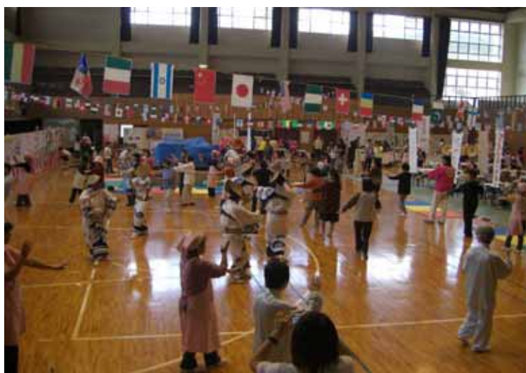
健康づくりの輪を広げるイベント（しまびと元気まつり）

今後、ますます少子高齢化が進む本市において、すべての市民が健やかで心豊かに自立した生活をしていくためには、従来どおりの保健事業を実施するだけでなく、目標値を定め、健康づくりに関連する部局、関係機関、団体等との連携を図りながら、健康増進計画「健幸さど21」に基づき、総合的に事業を推進するとともに、市民一人ひとりが、自分の意思によって健康づくりに取り組めるよう支援していくことが求められています。