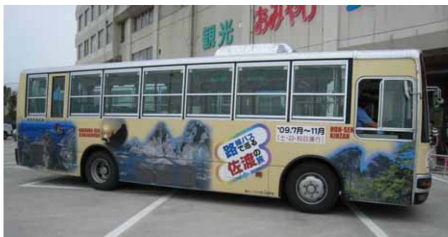
ラッピングバスによる観光二次交通の社会実験

パーク&ライド...最寄りの駅や停留所まで自家用車等で行って駐車し、そこから公共交通機関へ乗り継ぐ方式。