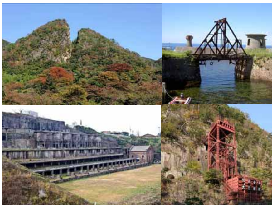
世界遺産構成資産の数々

本市では、これら文化遺産を佐渡の宝として後世に永く伝える方策の一つとして、ユネスコの世界遺産登録を目指して構成資産となる各種文化財を調査・研究し、国などの文化財指定を促進してきました。その結果、平成 20 年 9 月に「世界遺産暫定一覧表に記載が適当な資産」との決定を受けました。今後、本登録に向けて、世界遺産登録推進体制を強化するとともに、各種事業を迅速かつ効果的に進める必要があります。