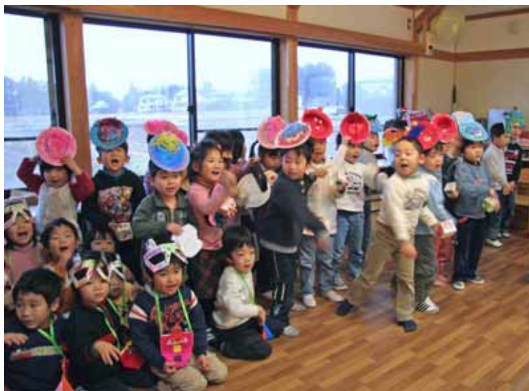
多様化する保育ニーズ

DV...ドメスティックバイオレンス。一般的に夫や恋人など親密な関係にある又はあった男性から女性に対して振るわれる暴力のこと。