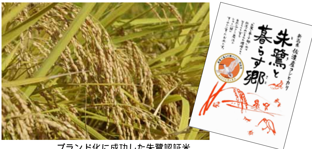
ブランド化に成功した朱鷺認証米