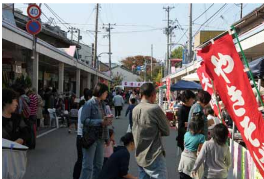
商店街の集客イベント（すわ参道オープンマーケット）

また、特産品の販路拡大のため首都圏物産展、地場産品商談会への積極的な支援を行い大消費地への市場開拓を推進します。