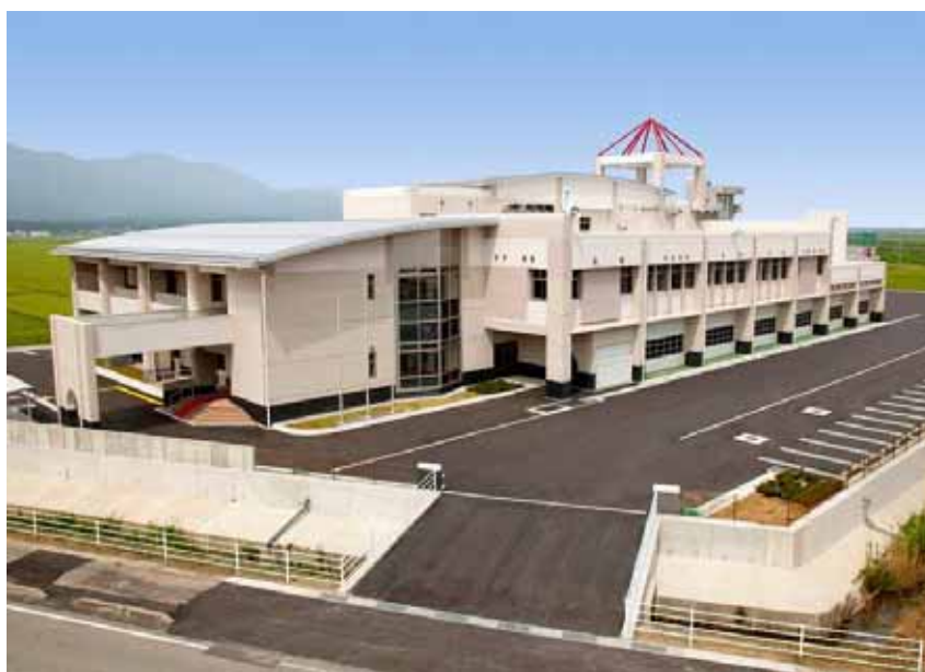
新築された消防庁舎

救急業務については、出場件数が増加傾向にあり、救急隊員が迅速かつ的確に応急処置ができるよう傷病者の被害の軽減を図る教育・体制づくりに取り組んでいます。