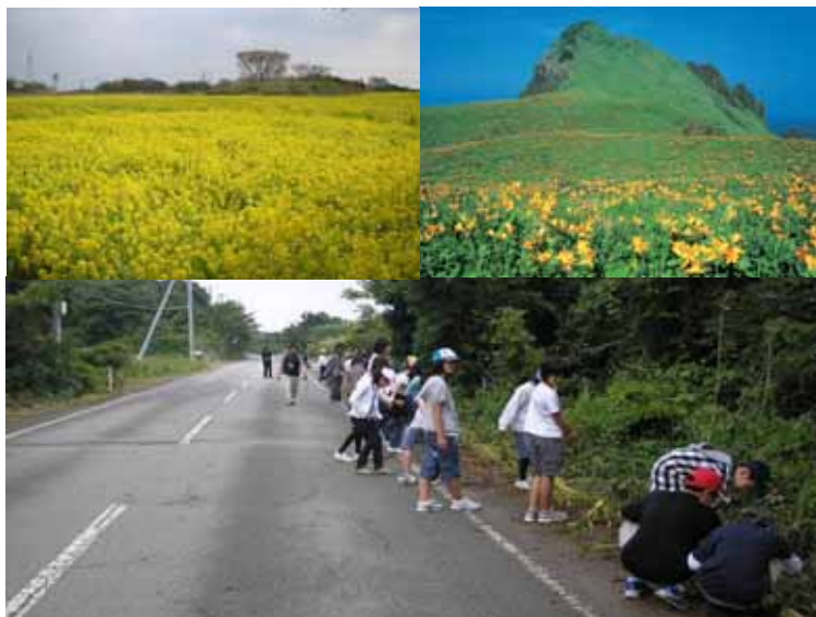
地域おこし活動（海府イエローロード事業）

公共施設の管理・運営など、民間と行政との役割分担を踏まえた上で、民間活力の導入を推進します。