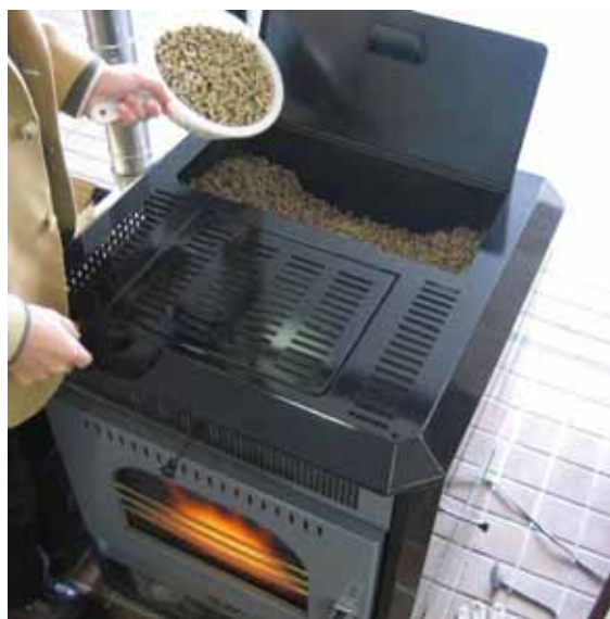
間伐材を利用したペレットストーブ

本来の森林の役割を改めて認識し、山の持つ多様性を十分に発揮できるよう地域住民と協力し森林整備を進めることを通して、山や森や木に関心が持てるよう啓発します。