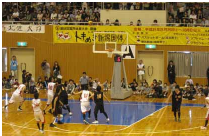
トキめき新潟国体（両津総合体育館）