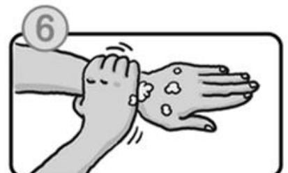
手首も忘れずに洗います。

◎帰宅時や調理の前後、食前など こまめに手を洗いましょう。 ◎爪は短く切っておきましょう。 ◎インフルエンザウイルスには、 アルコール手指消毒剤も効果 があります。