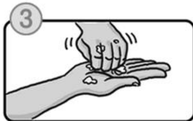
指先・爪の間を念入りにこすります。