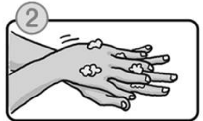
手の甲をのぼすようにこすります。