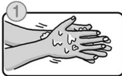
流水でよく手をぬらした後、石けんをつけ、手のひらをよくこすります。