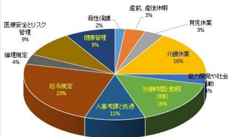
知りたい制度など(看護職)